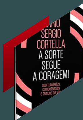
A sorte segue a coragem