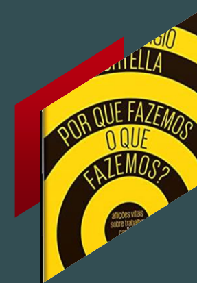
Por que fazemos o que fazemos?