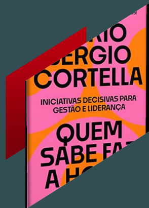
Quem sabe faz a hora